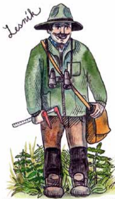
Oba dva - lesník i myslivec chodí do lesa. Myslivec ale není totéž, co lesník. I dospělí si to někdy pletou. Někteří lesníci jsou také myslivci, myslivci ale většinou nejsou lesníci.