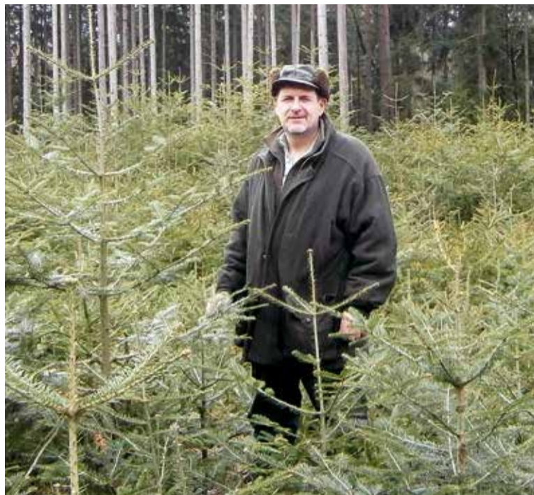
Úspěšná přirozená obnova jedle bělokoré – revír Klucké Chvalovice