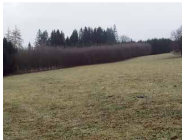
Smíšený porost vzniklý zalesněním bývalé zemědělské půdy