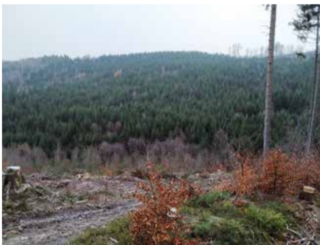
Prosperující porost středního věku založený po větrné kalamitě v 80. letech minulého století