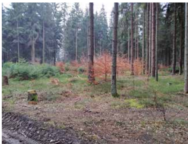
Následný porost vzniklý kombinací přirozené a umělé obnovy BK a SM